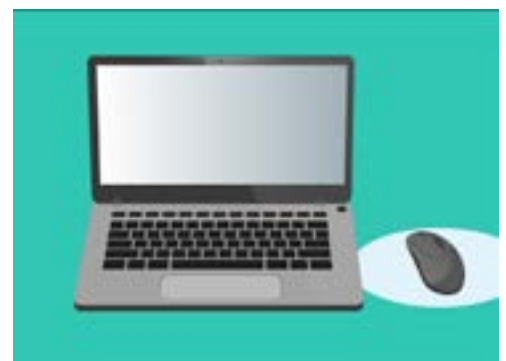
使用您的密碼登入電腦